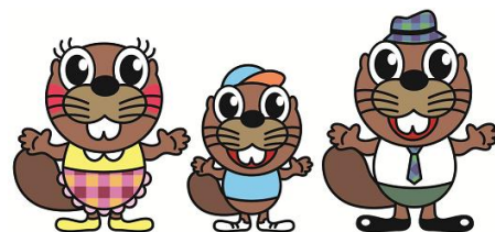
（建設職能国保組合イメージキャラクター）