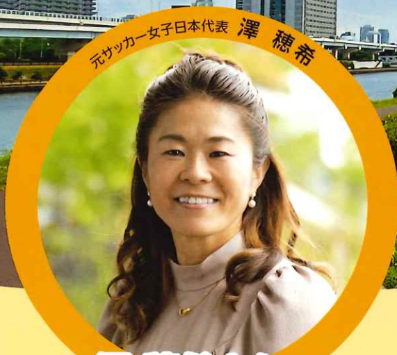
元サッカー女子日本代表 澤 穂希